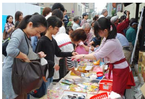
入口付近での駄菓子の販売

◎ 現在、草加松原の街道沿いにお休み処を設ける研究をしています。(文化観光プロジェクト委員会と協力)