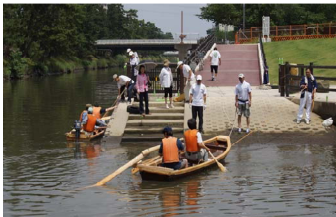
櫓漕ぎの研修風景